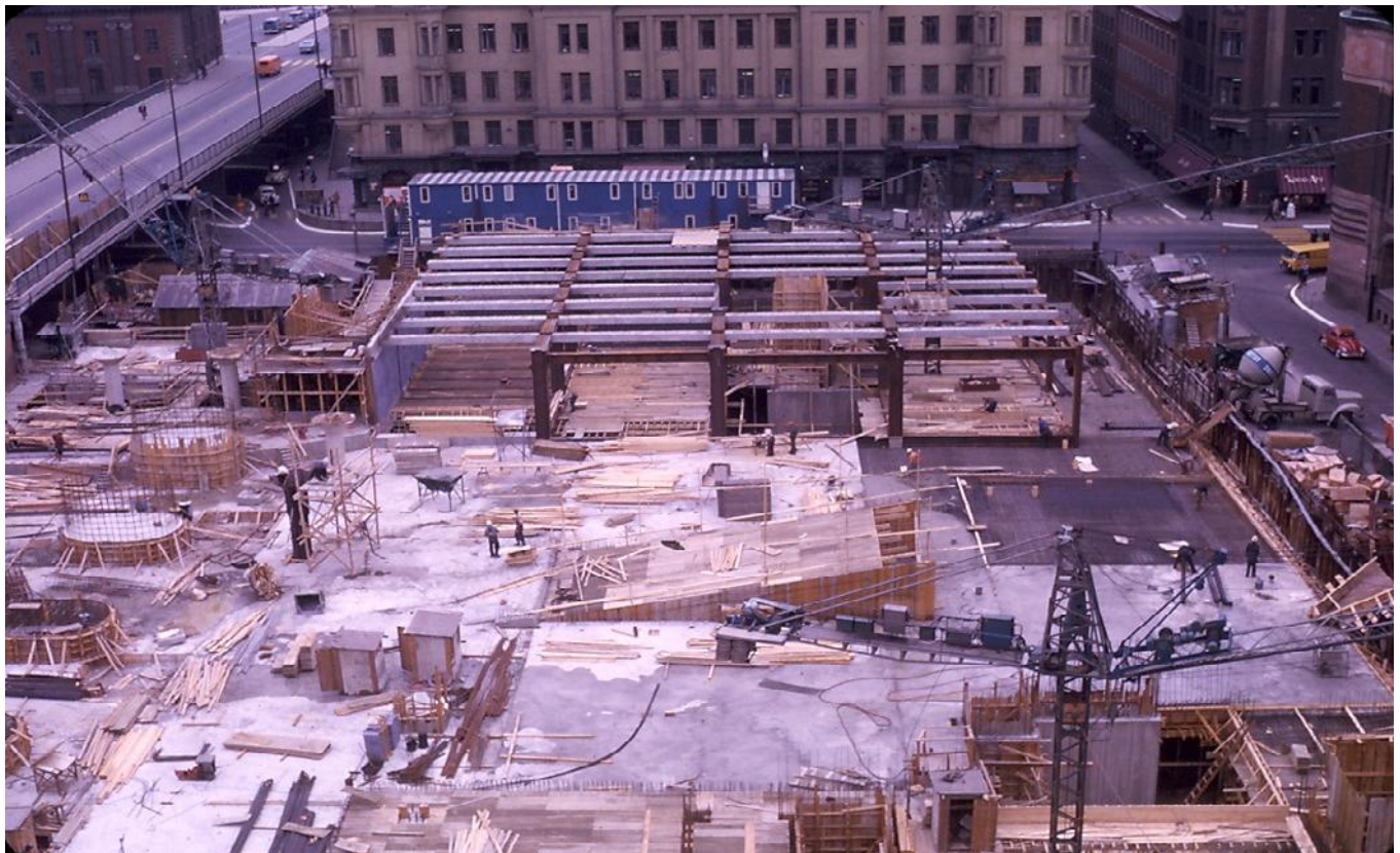
Utsikt från yttertaket på Ähléns City 1963